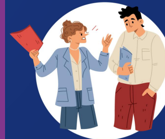
Violencia en el Trabajo